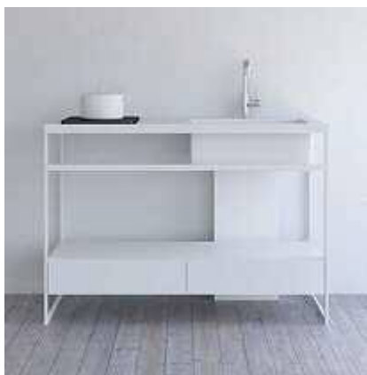
キッチンイメージ