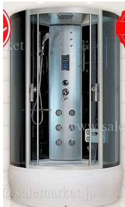
シャワーユニットイメージ